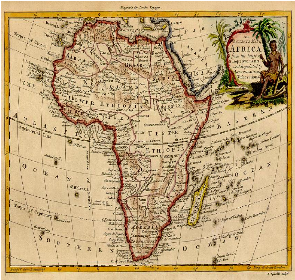
ካርታ 3. የኢትዮጵያን (የአፍሪካን) ዝቅተኛና ከፍተኛ መሬቶች እሚያሳይ ካርታ

በምእራብ አፍሪካ ይኖር የነበረው ጥቁር ሕዝብ “ኢትዮጵያ” በሚለው ስም በመታወቁ በዚያ በኩል ያለውን (የአትላንቲክ) ውቅያኖስ “የኢትዮጵያ ውቅያኖስ” እያሉ ይጠሩት ጀመር። በምእራብ አፍሪካ በኩል “የኢትዮጵያ ውቅያኖስ” ተብሎ የተጻፈባቸው ካርታዎች ብዙ ናቸው።